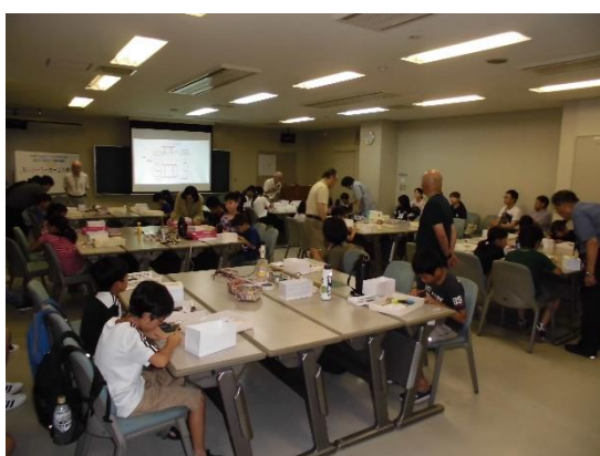
ソーラーカー作成の様子

当日は、午後から防府の団体を見学するため、11:35の電車に乗る必要があり、最後に完成してソーラーカーが走るところを見られなかったのが残念でした。