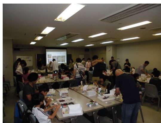
保護者が我慢できずに手伝いに