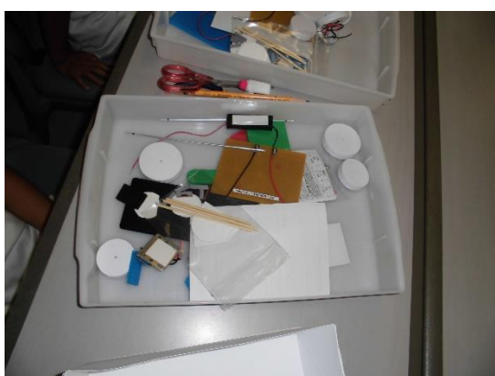
配布されたキット(手作り)